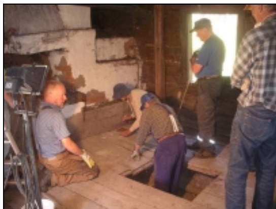
Golvplankorna i storstugan skall tillfälligt tas bort Tuvan lankkulattia on tilapäisesti poistettava

Jokainen voi myös tukea korjaustyötä liittymällä kyläyhdistyksen jäseneksi → katso lähemmin sivu 8.