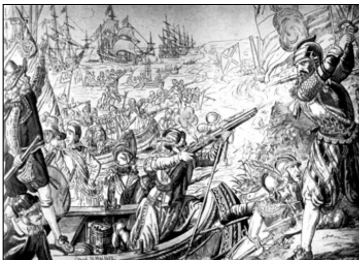
Tanskalaiset nousevat maihin Ölandiin v. 1612

H östen 2007 kommer att gå till historien som en tidpunkt då Mogenpört var föremål för stor uppmärksamhet från många håll.