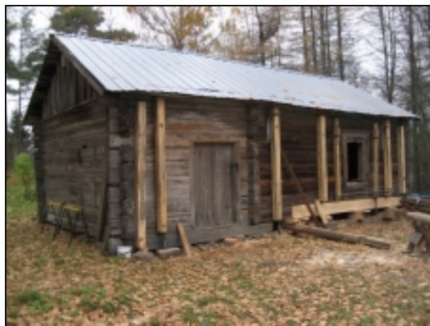
En del av det nedersta stocklagret förnyats Osa alimmasta hirsikerroksesta vaihdetaan