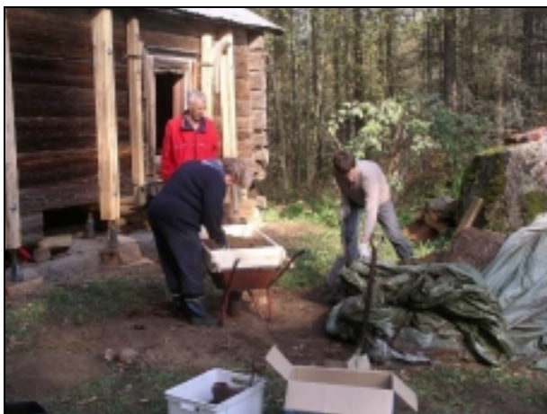
Mullbänkarna töms och innehållet siktas Multiaispenkit tyhjennetään ja sisältö seulotaan

Viimeinen Vanhassa Hinkabölessä asunut henkilö kuoli 1921. Tämän jälkeen rakennuksista tuli museo. Tältä rakennukset näyttivät 50-60 vuotta sitten.