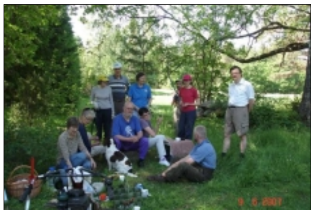
Ängstalko tillsammans med Pyttis Natur Ketotalkoot yhdessä Pyhtään Luonnon kanssa

Var och en kan också stöd a renoveringsarbetet genom att bli medlem i byaföreningen → se sidan 8.